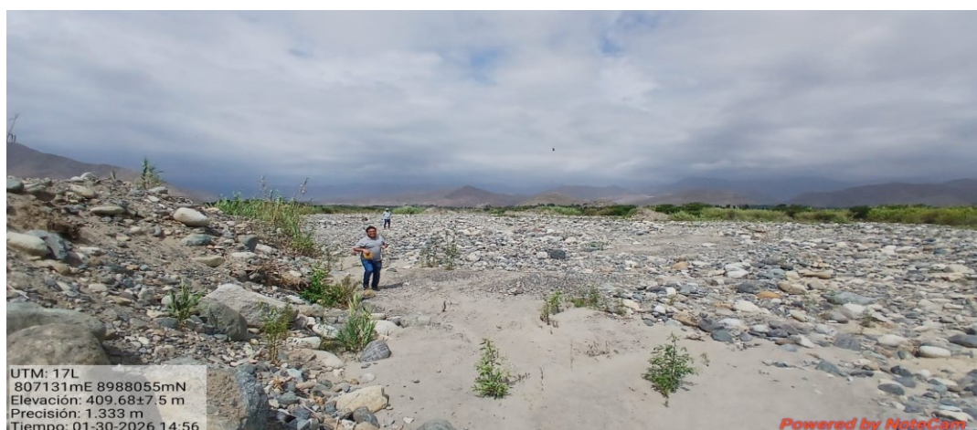
FIGURA N°02.- EN LA FOTOGRAFIA EL DIQUE DE LA MARGEN DDERECHA Y IZQUEIRDA AN DESAPARECIDO POR LA SOCAVACION DE LAS AVENIDAS DEL RIO NEPEÑA