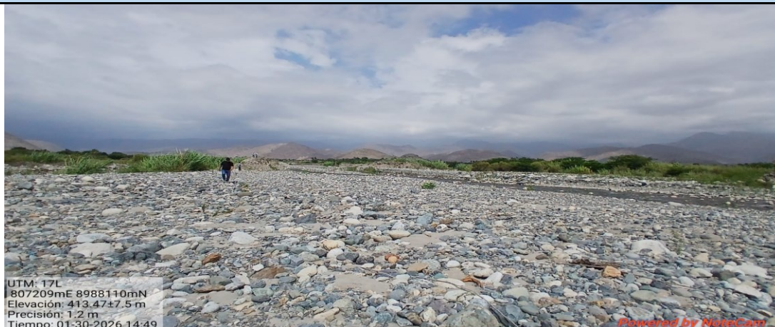
FIGURA N°1 TRAMO DEL CAUCE DEL RIO NEPENA COLMATADO, UNA ALTURA APROXIMADAMENTE DE 0.70M.